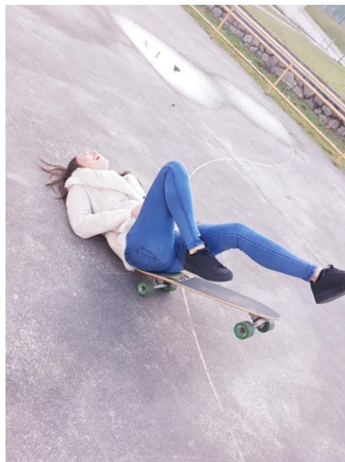
»Opal in Leja sva že pravi mojstrici« Lastni vir.